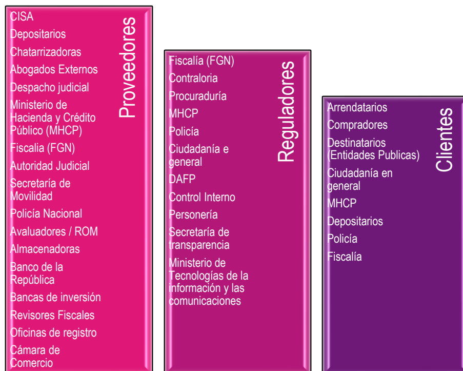
Figura 3. Partes interesadas.