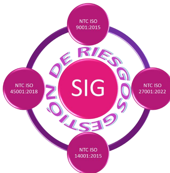
Figura 1. Alcance del Sistema Integrado de gestión.