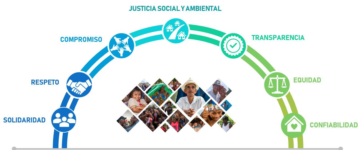
Figura 1. Valores SAE 2023-2026

Fuente: Elaboración Dirección de Planeación y Prospectiva