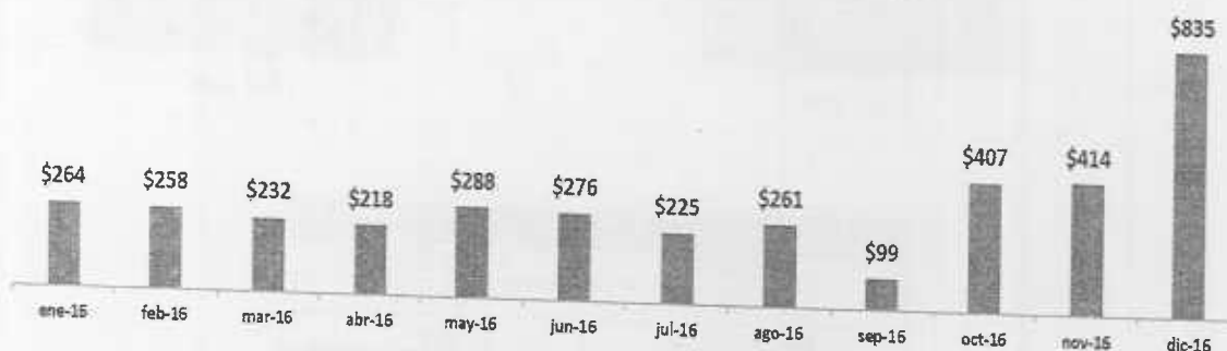
RECAUDO COBRO PERSUASIVO DE CARTERA CISA

De la misma manera se realizó un comparativo de los recaudos efectivos entre el año 2015 y el año 2016.