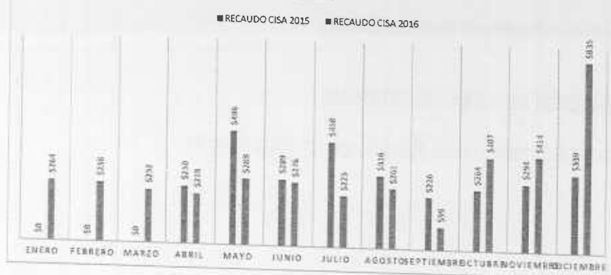
EVOLUCIÓN RECAUDO RECUPERACIÓN DE CARTERA CISA

De la misma manera se realizó un comparativo de los recaudos efectivos entre el año 2015 y el año 2016.